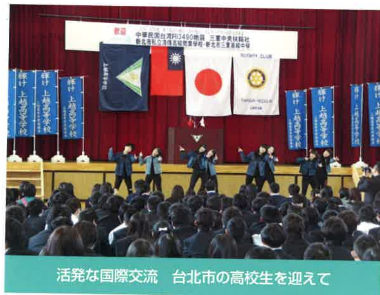
活発な国際交流 台北市の高校生を迎えて