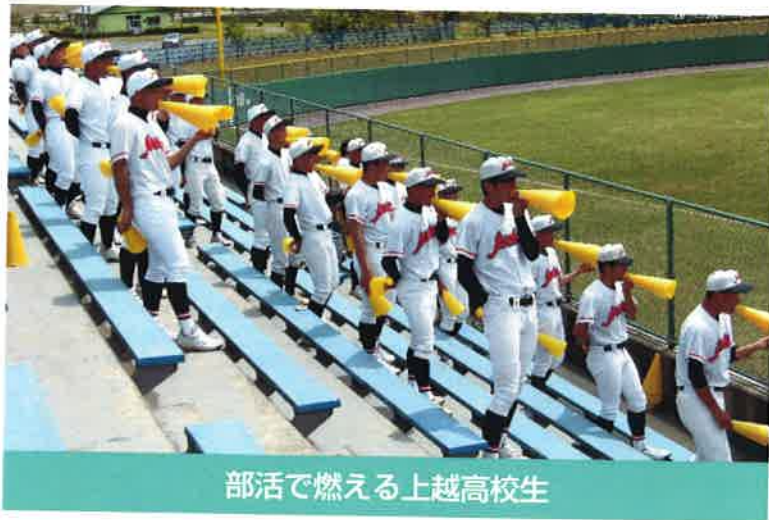
部活で燃える上越高校生