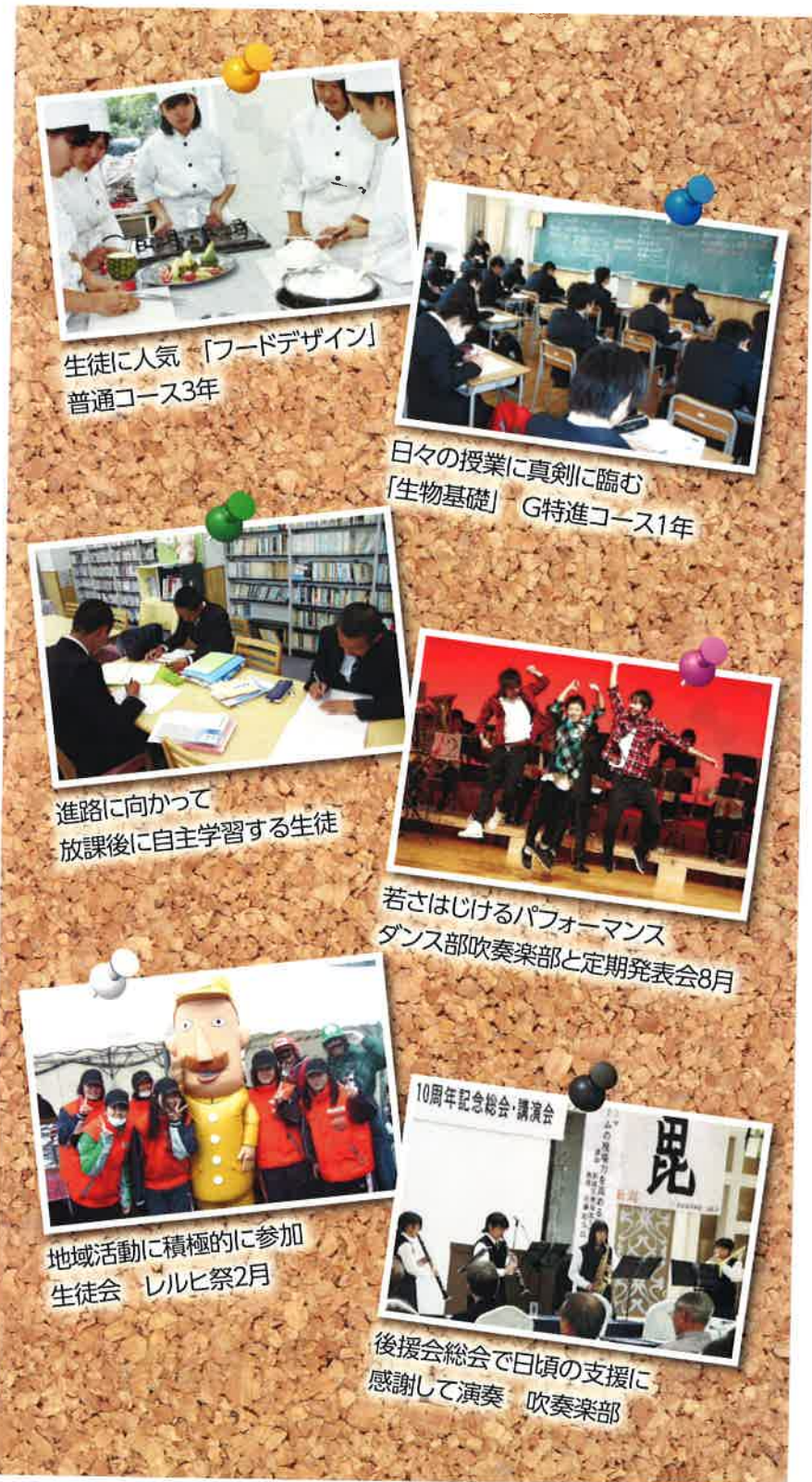
生徒に人気 「フードデザイン」 普通コース3年